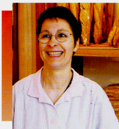
Violette Salut Boulangerie Salut Voisine de L'espace Garonne

À l'image de ces bâtiments publics, un beau parc, public lui aussi et probablement agrémenté d'une pièce d'eau, viendra compléter le dispositif vert de ce quartier des Sept Deniers qui borde la route de Blagnac et tient son nom de la somme, sept deniers, dont il fallait, il y a bien longtemps, s'acquitter pour pénétrer dans la ville.