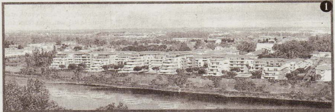
fin 2008-2011 : le bâtiment « Amiral »

Aujourd'hui, les engins de chantier s'activent en bord de Garonne et les premiers des 655 logements prévus sur le site doivent être livrés fin décembre 2006. Cette zac privée (les terrains ont été vendus à la barre du tribunal, une procédure plutôt rare justifiée par la fin judiciaire et tumultueuse de l'usine Job), implique plusieurs constructeurs pilotés par le groupe Belin. Le programme prévoit 50 % en accession à la propriété, 25 % de logement social et 25 % en location privée qui seront livrés jusqu'en