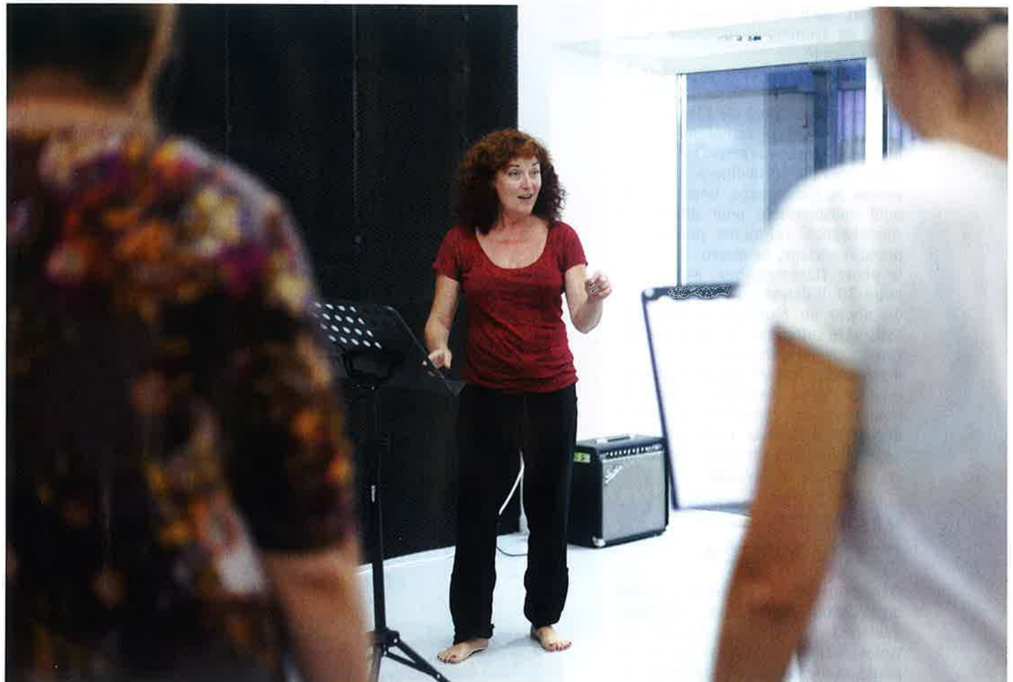
Un professeur de chant dans les locaux de Music'Halle.