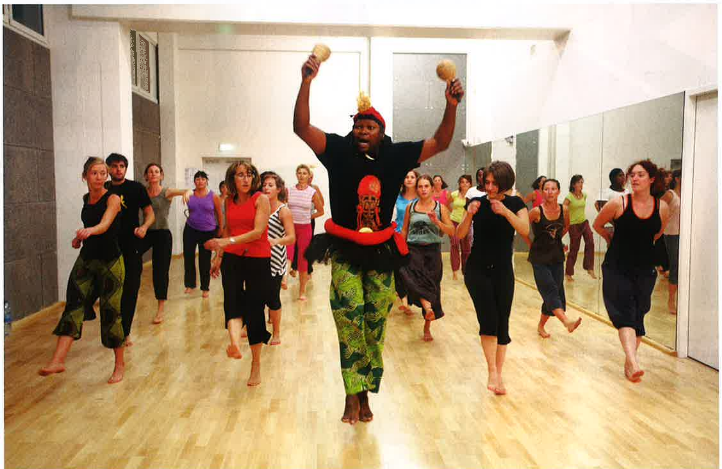
Un cours de danse africaine, dans l'une des salles de sport. D'autres disciplines sont enseignées par la MJC des Ponts Jumeaux, telles que la gym énergétique, le yoga, la sophrologie, le qi-gong ou l'aïkido.