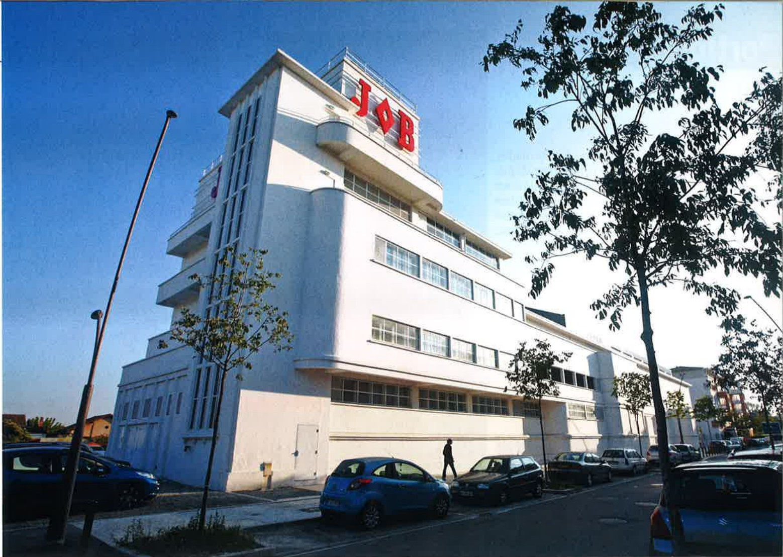
D'inspiration maritime, le Paquebot, dont les lignes et la tour Art Déco évoquent un immense navire, reprend l'esprit des constructions de Robert Mallet-Stevens. Il demeure un témoignage essentiel du patrimoine industriel des années Trente.